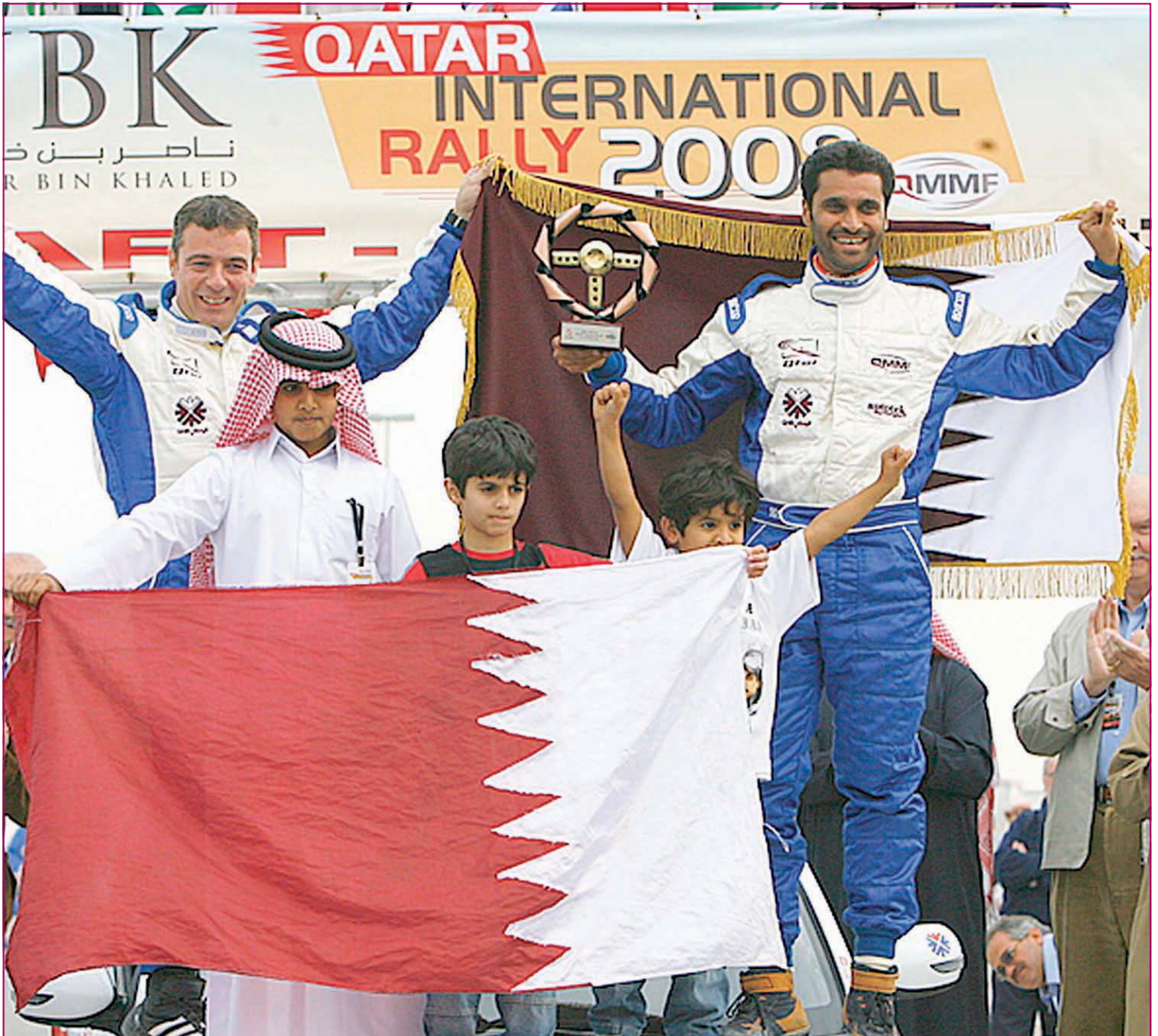
□ البطل القطري يخطف أولى خطواته للاحتفاظ بلقب الشرق الأوسط